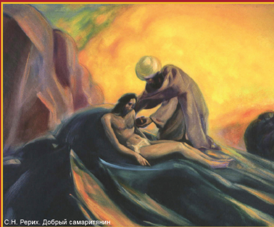
С.Н. Рерих. Добрый самаритянин