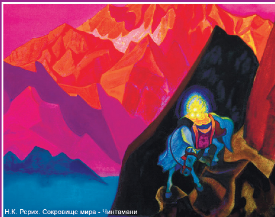
Н.К. Рерих. Сокровище мира - Чинтамани