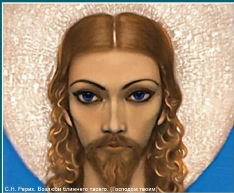
С.Н. Рерих. Возлюби ближнего твоего. (Господом твоим)